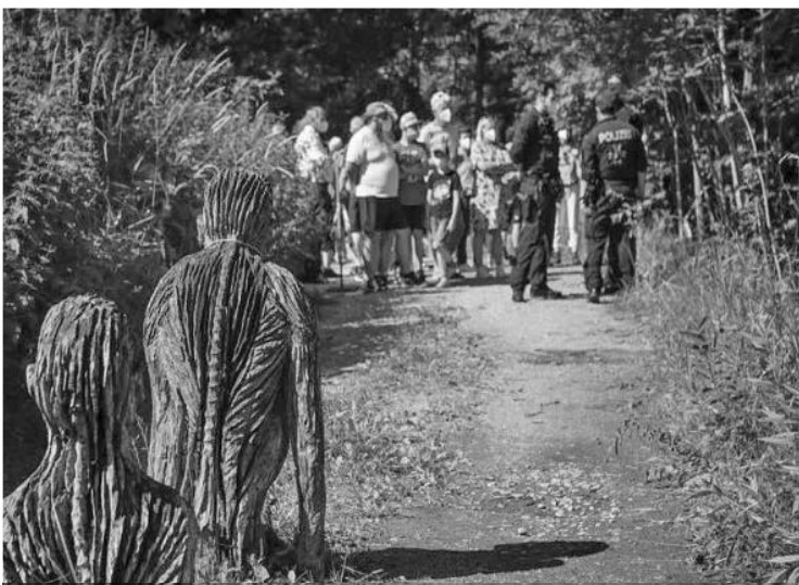
Die Kunstwerke warten ganz gespannt auf die Besucher

Ursprünglich sollte die Figur auf den gemeindeeigenen Weg innerhalb der Kiesgrube aufgestellt werden, der bereits 2016 zu einer Bürgerentscheid geführt hatte. Den Zugang zu diesem öffentlichen Gemeindegeweg hat die Fa. Zosseder GmbH aber nicht freigegeben. Leider konnte auch der Einsatz unseres Bürgermeisters und 2. Landrates Josef Huber nichts daran ändern. Wir sind aber zuversichtlich - gemeinsam mit der Gemeinde - die Renaturierung des gesamten Geländes erreichen zu können. Um den Forderungen einer Aufforstung anschließend Nachdruck zu verleihen, zog ein Demonstrationzug zum Parkplatz an der B304, wo nahe der Innbrücke auch gegen die im Dezember durchgeführte Rodung protestiert wurde.